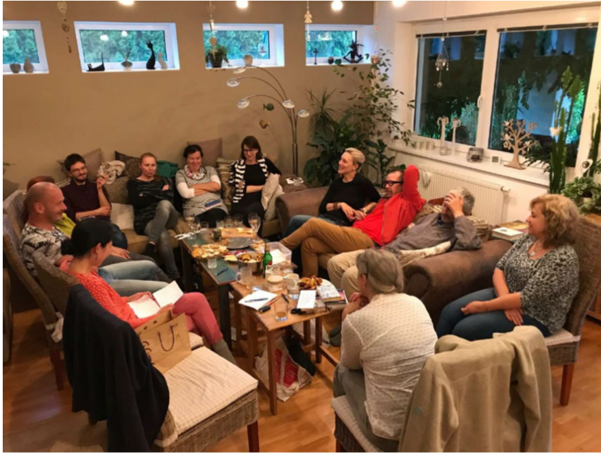
句会月見草 in ヴォドニャニ