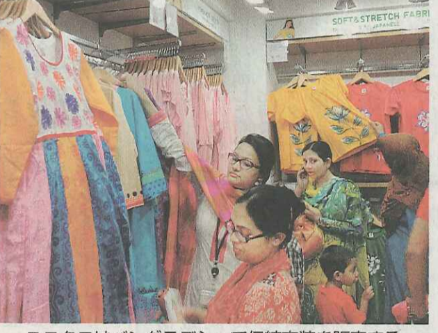
ユニクロはバングラデシュで伝統衣装を販売する

インドやアフリカの農村部には約40億人の世帯収入は年3千ドル未満。だが経済成長でいずれは自社の顧客となり、コカ・コーラ製品を売るパートナーともなり得る。ケントが見据えるのは「未来の市場作り」だ。 「産業革命以来の変化が続く」と話すのは米経営コンサルタントのラム・チャラン。震源は新興国、特に北緯30度以南のアジアやアフリカで進む「南」発経済成長や技術革新だと言いつつ、