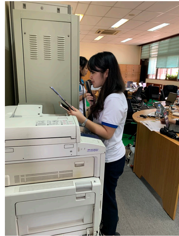
・場内アナウンス