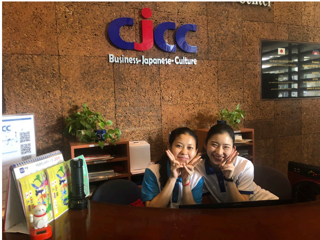
・インフォメーションデスク